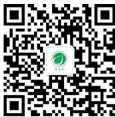
学生处微信公众号

7. 资助热线: 0877-2991715、0877-2991720, 开通时间: 2018年8月16日-9月1日(周六、日除外) 08:00-11:30, 14:00-16:30。